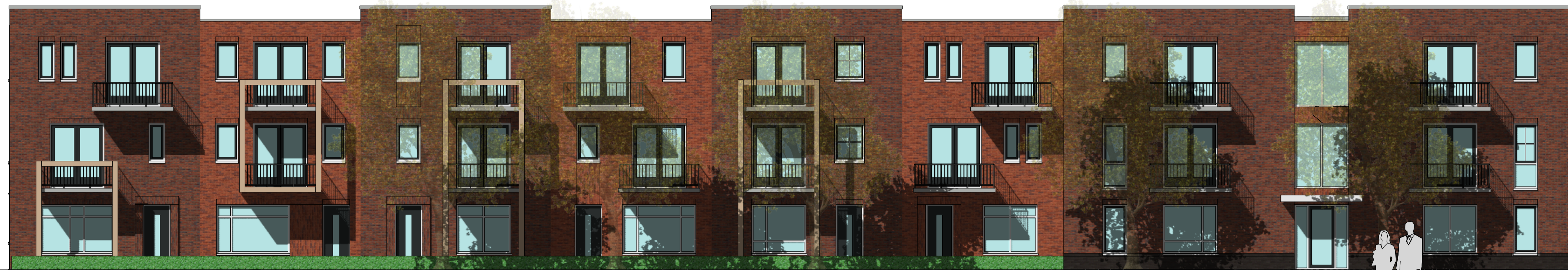
---- voorgevel ----