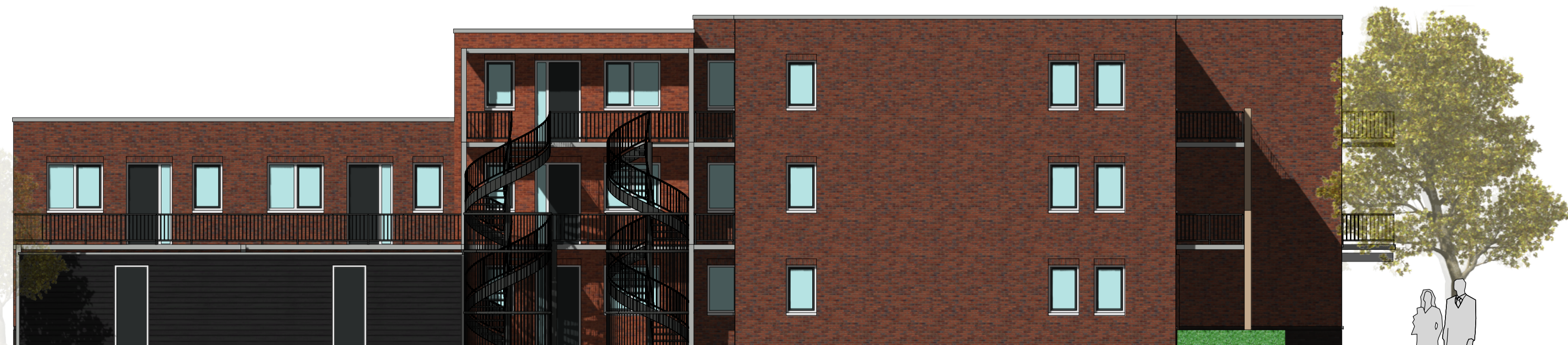
---- linkergevel ----