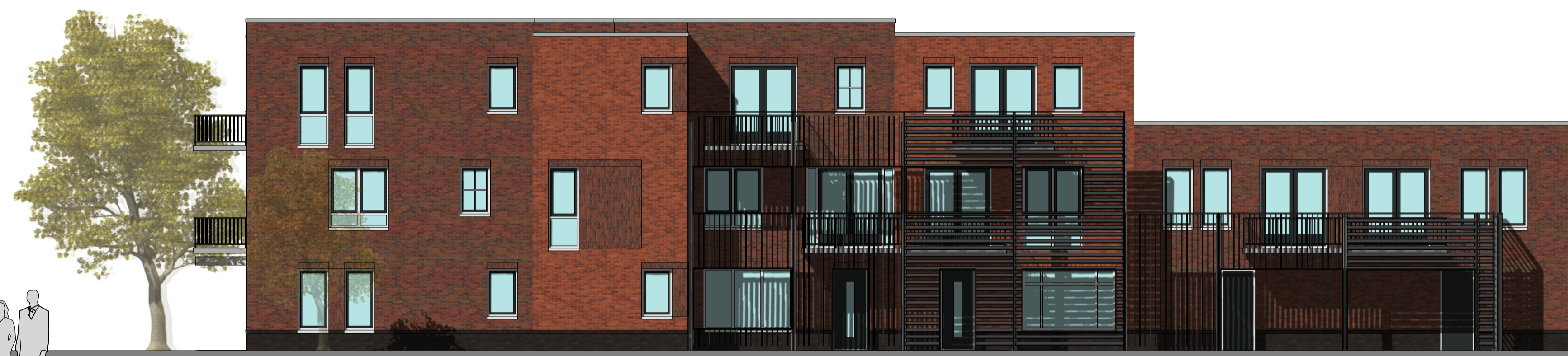
---- rechtergevel ----