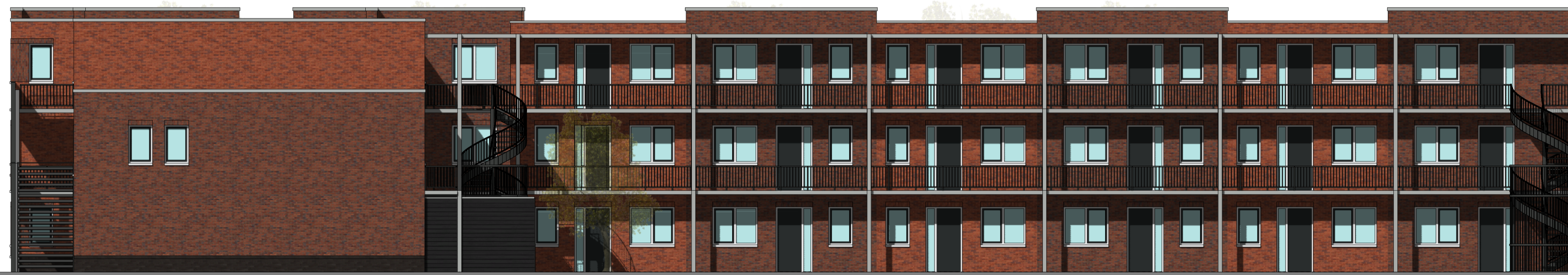
---- achtergevel ----